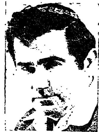
هاجر الى برنامج الوزارة المتعلق بمشكلة نقص المباني المدرسية في الوسط العربي والمساكن التي تبذلها من اجل التغلب على هذه المشكلة .

الناصر - لراسلنا شريف محمد - عقدت امس اللجنة الفرعية التابعة عن لجنة المعارف التابعة للكنيسة برئاسة عضو الكنيسة السيدة اوره نير جلسة خاصة لواصله الابحاث التي تجريها منذ مدة والمتعلقة بنقص غرف التدريس في الوسط العربي. وقد حضر هذه الجلسة وزير المعارف والتثاقفة السيد زيولون هابر والمدير العام للوزارة السيد اليعيزر شوميلسي ونائب مدير دائرة المعارف والتثاقفة للمرب السيد علي حيدر ، كما اشرك في هذا الاجتماع ممثلون عن وزارة المالية ومركز السلطات المحلية ورئيس بلدية شفا عمرو وروساء المجالس الخلية في مجد الكروم وجت ، وعرة ، والجديدة ، وعراية . واستمعت اللجنة من السيد زيولون